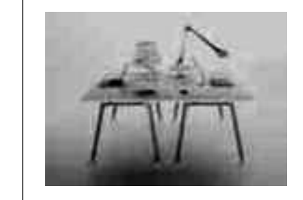
♦ Стол для дома и офиса ATM Advanced table module. 2002.

Дизайнер часто воспринимается как некто, придающий форму промышленным изделиям - человек, чья технологическая экспертиза обеспечивает последующее производство предмета. Как и многое другое, это непростое: подход к конкретной проблеме невозможно записать в виде инструкции - решение всегда приходит с неожиданной стороны. Волею случая форма может появиться в результате усердного