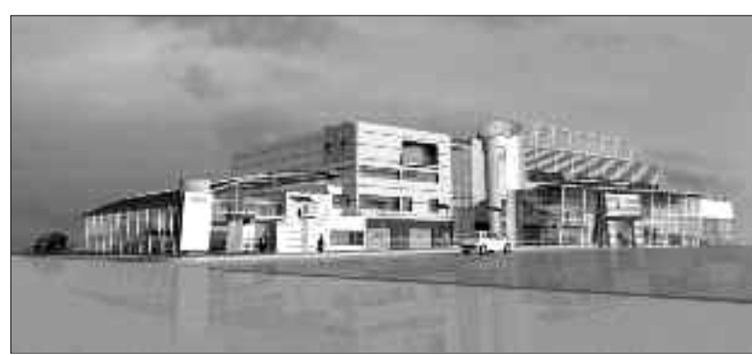
Dərnəgül şossesindəki "Audi" autohouse-un layihəsi

Kollektivin ilk baxışdan adı görünən bir fəaliyyət devizi vardır: "Sadəlik - gözəllikdir!" İbrahim müəllimin fikrincə, layihələr mürəkkəb elementlərlə nə qədər zəngin olursa, memarın