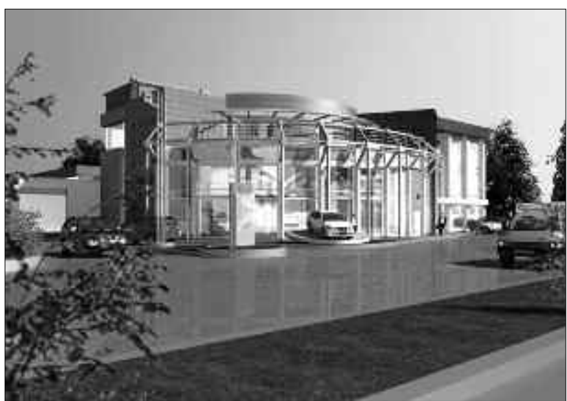
Babək prospektindəki avtosalonun layihəsi

ELƏ bir kooperativin yaradılmasının bir neçə səbəbi var idi. Hər şeydən əvvəl bu istedadlı gənclər öz bilik və bacarıqlarını təcrübədə sınaqdan keçirmək istəyirdilər. Onların qarşısında "Memar tikintidən asılıdır" kimi köhnəmiş Sovet stereotipini sındırmaq vəzifəsi dururdu. Bütün dünyada tikintiyə ümumi rəhbərliyi memar həyata keçirir. Çünki layihəni hazırlayan memardır və tikintinin də gedişinə məhz o nəzarət etməlidir. Azərbaycanda da sifarişçi-memar-icraçı zəncirində çox şey dəyişilməli idi.