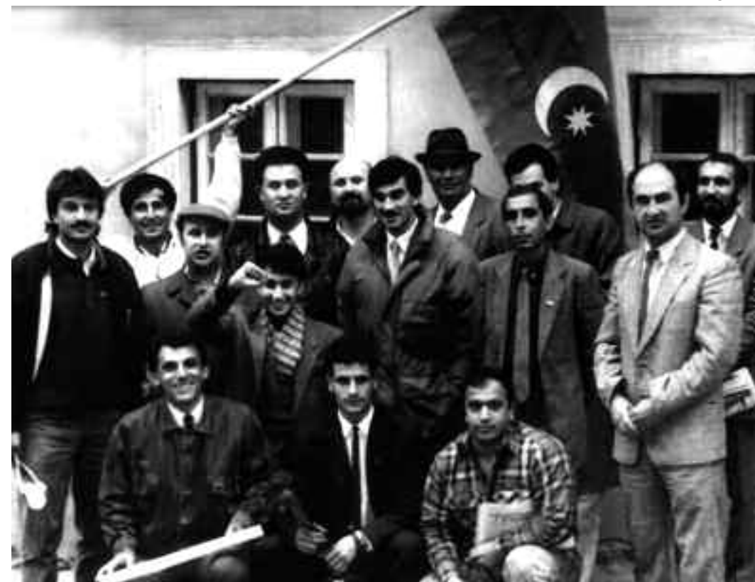
Sovetlər Birliyində yaşayan azərbaycanlıların I qurultayının iştirakçıları

1942-ci ildə Stokholmda yaranan və SSRİ-dən xaricdə fəaliyyət göstərən Avropa Estoniya Hərəkatının ideyası əsasın-