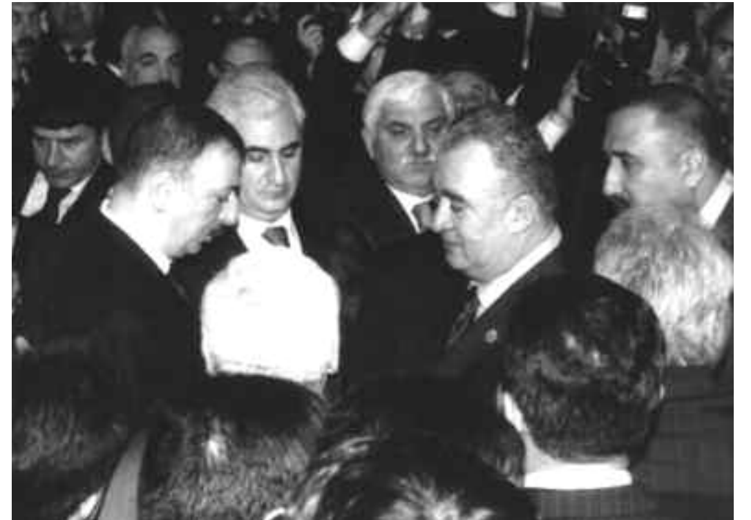
Dünya Azərbaycanlılarının II qurultayında

ğnları ləngimədən dayandırmağı tələb etmişdi. Bakı faciəsinin Qərb ölkələrində böyük səs-küyə səbəb olacağından ehtiyat edən M.Qorbaçov, təbii ki, Avropanın kapitalist ölkələri ilə həmsərhəd olan Estoniyanın A.Ryutel kimi yüksək səlahiyyətli rəhbərinin tələbinə etinasız yanaşma bilməzdi. Buna görə də biz hesab edirik ki, 20 yanvar faciəsinin genişlənməsinin qarşısının alınmasında cənab Ryutelin də mü-