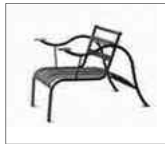
♦ Кресло Thinking Man's Chair. Прототип создан для Японской выставки, 1986.