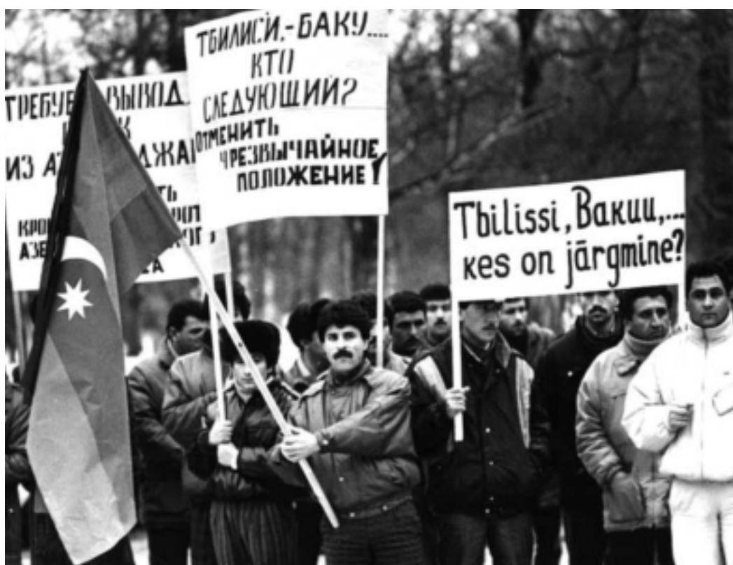
Estoniyadakı Azərbaycan diasporasının 20 yanvar hadisələrinə etiraz yürüşü

- Belə çıxır ki, icmanız bölgədə azərbaycanlıların aparıcı qüvvəsinə çevrilmişdi.