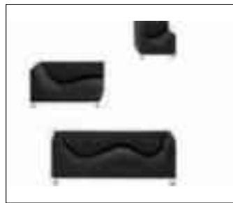
♦ Джаспер Моррисон (Jasper Morrison) - 2 дивана и кресло Sofa Deluxe для Cappelini 1991.